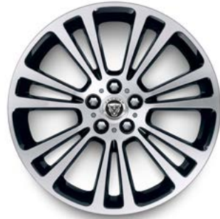
19" MIT 7 DOPPELSPEICHEN (STYLE 7013) GLOSS BLACK, DIAMOND TURNED Serienausstattung für R-Dynamic SE