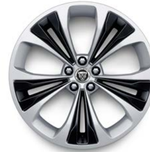
20" MIT 5 DOPPELSPEICHEN (STYLE 5107) GLOSS SPARKLE SILVER, GLOSS BLACK INSERTS Serienausstattung für 300 SPORT