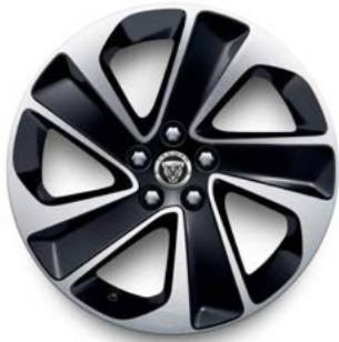
18" MIT 5 SPEICHEN (STYLE 5105) DARK GREY, DIAMOND TURNED Serienausstattung für R-Dynamic S