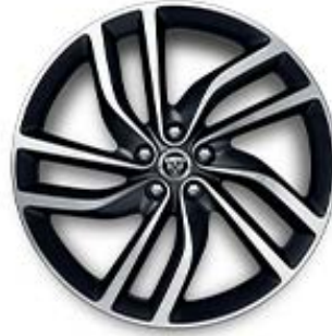
20" MIT 5 DOPPELSPEICHEN (STYLE 5036) GLOSS DARK GREY, DIAMOND TURNED Serienausstattung für R-Dynamic HSE