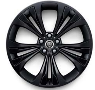
20" MIT 5 DOPPELSPEICHEN (STYLE 5107) SATIN BLACK, GLOSS BLACK INSERTS

Die angegebenen Optionen können den Verbrauch des Fahrzeugs beeinflussen. Konfigurieren Sie Ihren Jaguar unter jaguar.de oder wenden Sie sich direkt an Ihren Jaguar Partner.