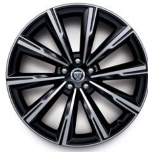
20" MIT 10 SPEICHEN (STYLE 1066) 5,6 GLOSS BLACK, DIAMOND TURNED, Serienausstattung für F-TYPE R75