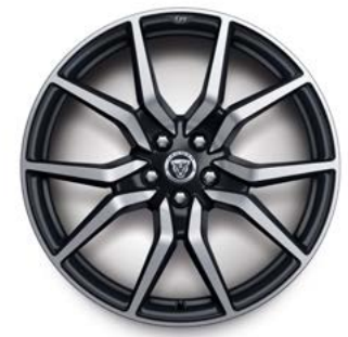
20" MIT 10 SPEICHEN (STYLE 1041) 5 SATIN BLACK, DIAMOND TURNED, GESCHMIEDET