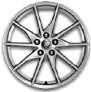
18" MIT 10 SPEICHEN (STYLE 5036) 1,2 GLOSS SPARKLE SILVER