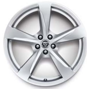
20" MIT 5 SPEICHEN (STYLE 5060) 1 GLOSS SPARKLE SILVER Serienausstattung für F-TYPE R-Dynamic