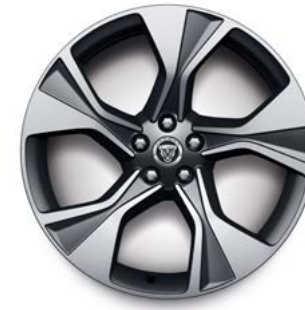
20" MIT 5 SPEICHEN (STYLE 5102) 3 GLOSS TECHNICAL GREY, DIAMOND TURNED