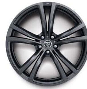
20" MIT 5 DOPPELSPEICHEN (STYLE 5061) 5,6 SATIN GREY, GESCHMIEDET