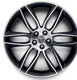
20" MIT 6 DOPPELSPEICHEN (STYLE 6003) 3 GLOSS DARK GREY, DIAMOND TURNED