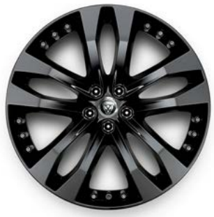
20" MIT 5 DOPPELSPEICHEN (STYLE 5039) 3 GLOSS BLACK