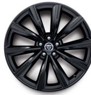
20" MIT 10 SPEICHEN (STYLE 1066) 5,6 GLOSS BLACK,