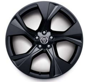
20" MIT 5 SPEICHEN (STYLE 5102) 4 GLOSS BLACK Serienausstattung für F-TYPE 75