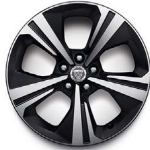
18" MIT 5 SPEICHEN (STYLE 5118) SATIN BLACK DIAMOND TURNED Serienausstattung für R-Dynamic S