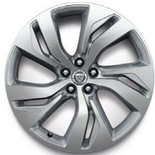
20" MIT 5 DOPPELSPEICHEN (STYLE 5120) SATIN DARK GREY, DIAMOND TURNED Serienausstattung für R-Dynamic HSE