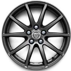
17" MIT 10 SPEICHEN (STYLE 1005) 1 SATIN DARK GREY