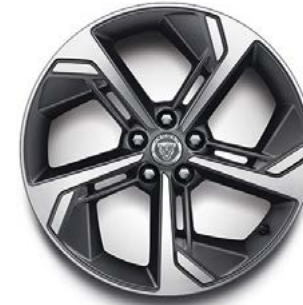
19" MIT 5 SPEICHEN (STYLE 5119) SATIN DARK GREY, DIAMOND TURNED Serienausstattung für R-Dynamic SE