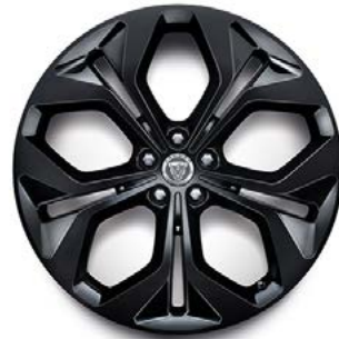
21" MIT 5 DOPPELSPEICHEN (STYLE 5053) 2 GLOSS BLACK