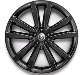
20" MIT 5 DOPPELSPEICHEN (STYLE 5051) GLOSS BLACK