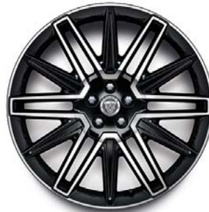
21" MIT 12 DOPPELSPEICHEN (STYLE 1078) 2 GLOSS BLACK, DIAMOND TURNED