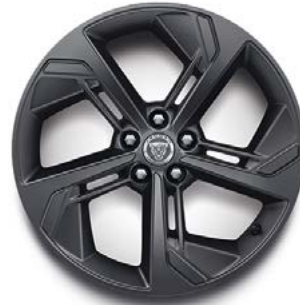
19" MIT 5 SPEICHEN (STYLE 5119) GLOSS DARK GREY