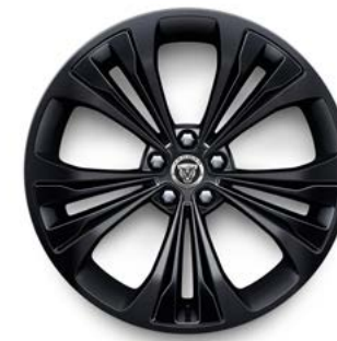
20" MIT 5 DOPPELSPEICHEN (STYLE 5107) SATIN BLACK, GLOSS BLACK INSERTS

Die angegebenen Optionen können den Verbrauch des Fahrzeugs beeinflussen. Konfigurieren Sie Ihren Jaguar unter jaguar.de oder wenden Sie sich direkt an Ihren Jaguar Partner.