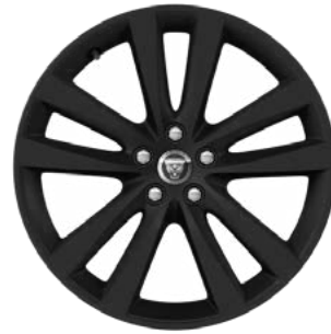
19" MIT 5 DOPPELSPEICHEN (STYLE 5031) GLOSS BLACK