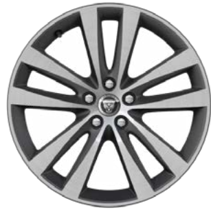
19" MIT 5 DOPPELSPEICHEN (STYLE 5031) GLOSS SILVER, DIAMOND TURNED Serienausstattung für R-Dynamic HSE