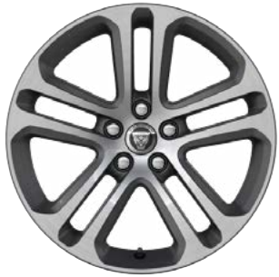
18" MIT 5 DOPPELSPEICHEN (STYLE 5029) GLOSS DARK GREY, DIAMOND TURNED Serienausstattung für R-Dynamic S