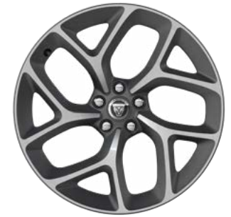
20" MIT 10 SPEICHEN (STYLE 1014) SATIN GREY, DIAMOND TURNED Serienausstattung für 300 Sport

*Nur für P250 und P300 AWD verfügbar. Nur in Verbindung mit Adaptive Dynamics (Adaptives Fahrwerk) verfügbar. Nur in Verbindung mit Notrad (Leichtmetall) verfügbar. Nicht in Verbindung mit Standheizung mit Fernbedienung über InControl Remote und Timerfunktion verfügbar.