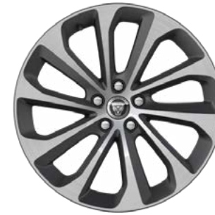
19" MIT 10 SPEICHEN (STYLE 1050) GLOSS DARK GREY, DIAMOND TURNED Serienausstattung für R-Dynamic SE