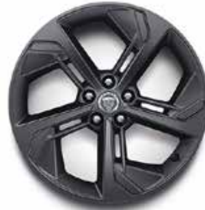
19" MIT 5 SPEICHEN (STYLE 5119) GLOSS DARK GREY