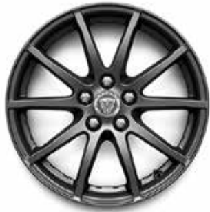
17" MIT 10 SPEICHEN (STYLE 1005) 1 SATIN DARK GREY