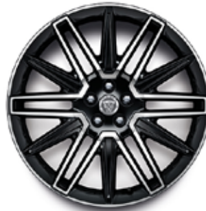
21" MIT 12 DOPPELSPEICHEN (STYLE 1078) 2 GLOSS BLACK, DIAMOND TURNED