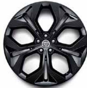
21" MIT 5 DOPPELSPEICHEN (STYLE 5053) 2 GLOSS BLACK