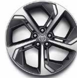
19" MIT 5 SPEICHEN (STYLE 5119) SATIN DARK GREY, DIAMOND TURNED Serienausstattung für R-Dynamic SE