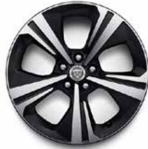
18" MIT 5 SPEICHEN (STYLE 5118) SATIN BLACK DIAMOND TURNED Serienausstattung für R-Dynamic S