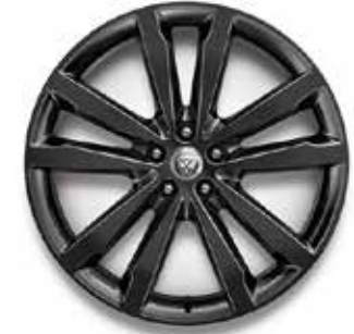
20" MIT 5 DOPPELSPEICHEN (STYLE 5051) GLOSS BLACK