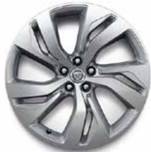
20" MIT 5 DOPPELSPEICHEN (STYLE 5120) SATIN DARK GREY, DIAMOND TURNED Serienausstattung für R-Dynamic HSE