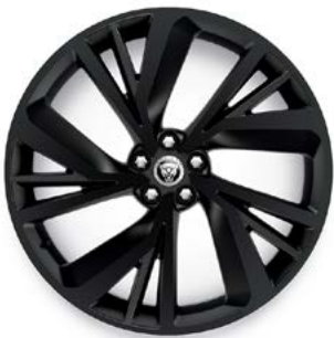
22" MIT 5 DOPPELSPEICHEN (STYLE 5056) 1 GLOSS BLACK