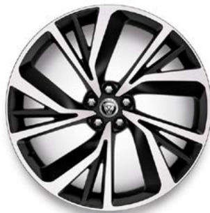
22" MIT 5 DOPPELSPEICHEN (STYLE 5056) 1 GLOSS DARK GREY, DIAMOND TURNED