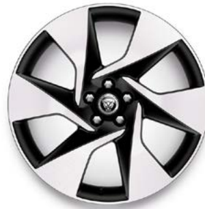
20" MIT 6 SPEICHEN (STYLE 6007) GLOSS DARK GREY, DIAMOND TURNED Serienausstattung für R-Dynamic SE