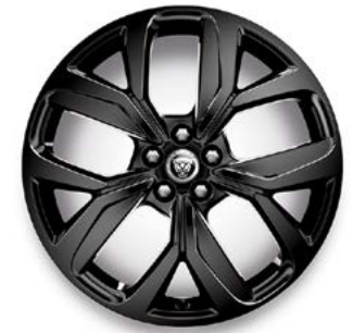
20" MIT 5 SPEICHEN (STYLE 5068) GLOSS BLACK