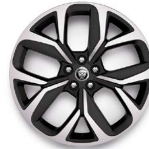
20" MIT 5 SPEICHEN (STYLE 5068) GLOSS DARK GREY, DIAMOND TURNED Serienausstattung für R-Dynamic HSE