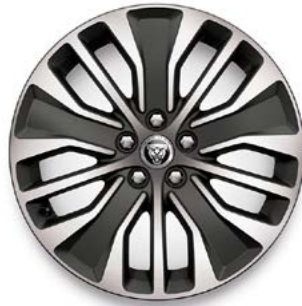
19" MIT 5 DOPPELSPEICHEN (STYLE 5055) GLOSS DARK GREY, DIAMOND TURNED