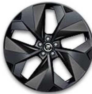
22" MIT 5 SPEICHEN (STYLE 5069) 1 SATIN DARK GREY, CARBON INSERTS