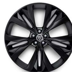
22" MIT 15 SPEICHEN (STYLE 1020) 4 GLOSS BLACK, SATIN BLACK INSERTS, GESCHMIEDET