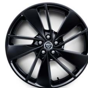
20" MIT 10 SPEICHEN (STYLE 1067) 1 GLOSS BLACK

Serienausstattung für R-Dynamic SE D200 AWD, R-Dynamic SE D300 AWD und R-Dynamic SE P250 AWD