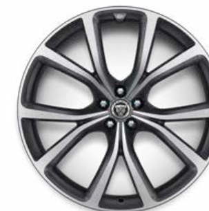
22" MIT 5 DOPPELSPEICHEN (STYLE 5081) 3 SATIN TECHNICAL GREY, DIAMOND TURNED, GESCHMIEDET