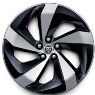
19" MIT 5 SPEICHEN (STYLE 5103) 1 GLOSS BLACK, DIAMOND TURNED

Serienausstattung für R-Dynamic S, R-Dynamic SE P400e AWD und R-Dynamic HSE P400e AWD