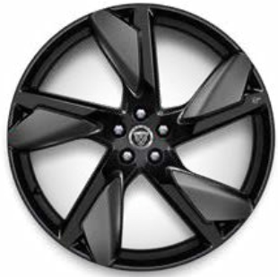
22" MIT 5 DOPPELSPEICHEN (STYLE 5117) 3 GLOSS BLACK, SATIN TECHNICAL GREY INSERTS, GESCHMIEDET