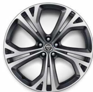
21" MIT 5 DOPPELSPEICHEN (STYLE 5080) 3 SATIN TECHNICAL GREY, CONTRAST DIAMOND TURNED, GESCHMIEDET

Serienausstattung für R-Dynamic HSE D200 AWD, R-Dynamic HSE D300 AWD und R-Dynamic HSE P250 AWD