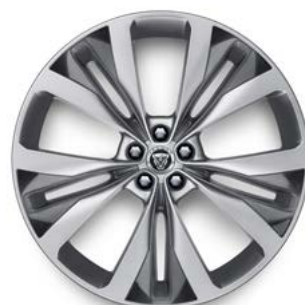
22" MIT 15 SPEICHEN (STYLE 1020) 4 GLOSS SILVER, CONTRAST INSERTS, GESCHMIEDET