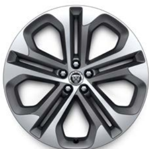
21" MIT 5 DOPPELSPEICHEN (STYLE 5104) 2 SATIN DARK GREY, DIAMOND TURNED

Serienausstattung für R-Dynamic HSE D200 AWD, R-Dynamic HSE D300 AWD und R-Dynamic HSE P250 AWD