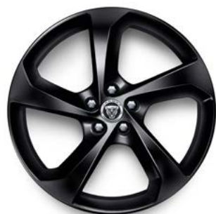
19" MIT 5 SPEICHEN (STYLE 5037) 1 GLOSS BLACK

Serienausstattung für R-Dynamic S, R-Dynamic SE P400e AWD und R-Dynamic HSE P400e AWD