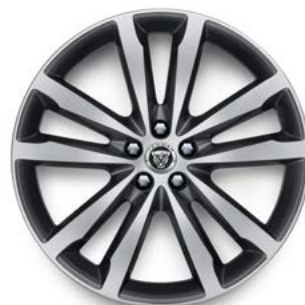
20" MIT 5 DOPPELSPEICHEN (STYLE 5031) 1 GLOSS GREY, DIAMOND TURNED

Serienausstattung für R-Dynamic SE D200 AWD, R-Dynamic SE D300 AWD und R-Dynamic SE P250 AWD