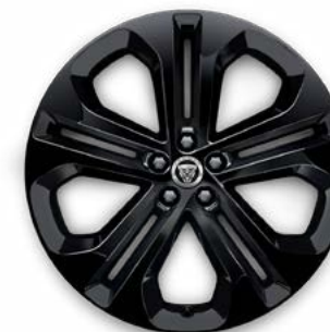
21" MIT 5 SPEICHEN (STYLE 5105) 2 GLOSS BLACK